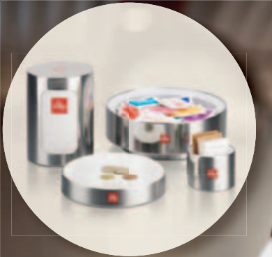
Accesorios para el servicio