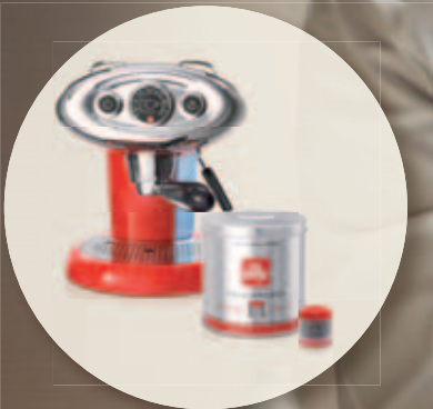
Productos para la venta

La imagen de los productos illy ayudan al profesional a incrementar las ventas.