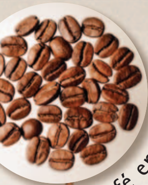
Café en grano