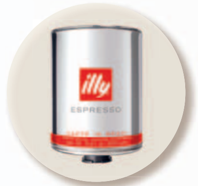
La lata de 3Kg